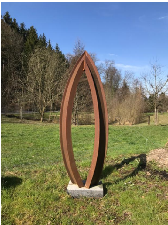
"Providencia" – Obra Pública Suiza Fierro soldado 180x60x50 cm 2018