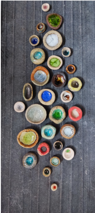
"Arte del oficio" Cerámica gress - medidas variables 10,000 piezas aprox. 2003 - 2021