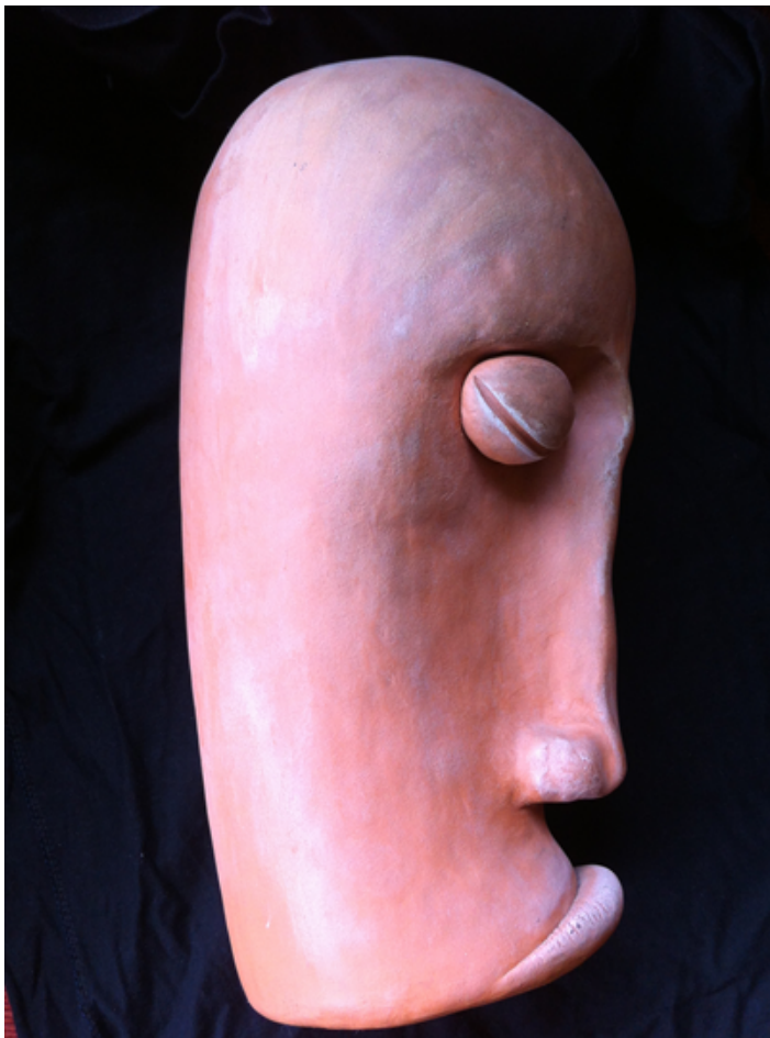
"Tristeza" Cerámica gress 45x20x20 cm 2012