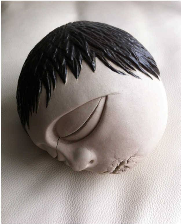
"Dry" Cerámica gress 20x20x20 cm 2012