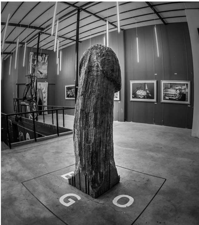
"Ego" Tallado en cajas de huevo – 186x60x60 cm 2015