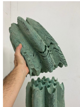
"Wachuma" Tallado en cajas de huevo - 80x24x24 cm 2019