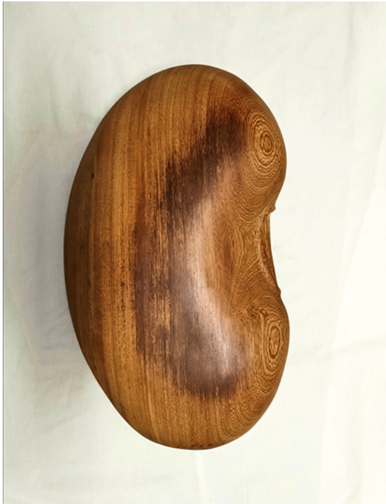
"Pallar" – Serie Magic seed Madera recuperada tallada 66x36x9 cm 2020