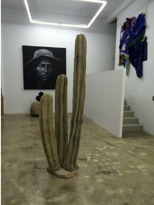
"Wachuma" Tallado en cajas de huevo – 240x80x80 cm 2016