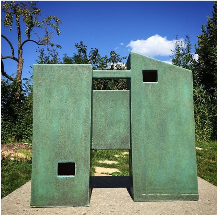
"Brutalismo" Cerámica gress - 35x30x20 cm 2018