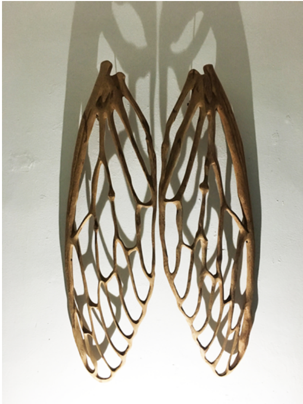
"Cigarra" Madera recuperada tallada - 139x50x9 cm 2020