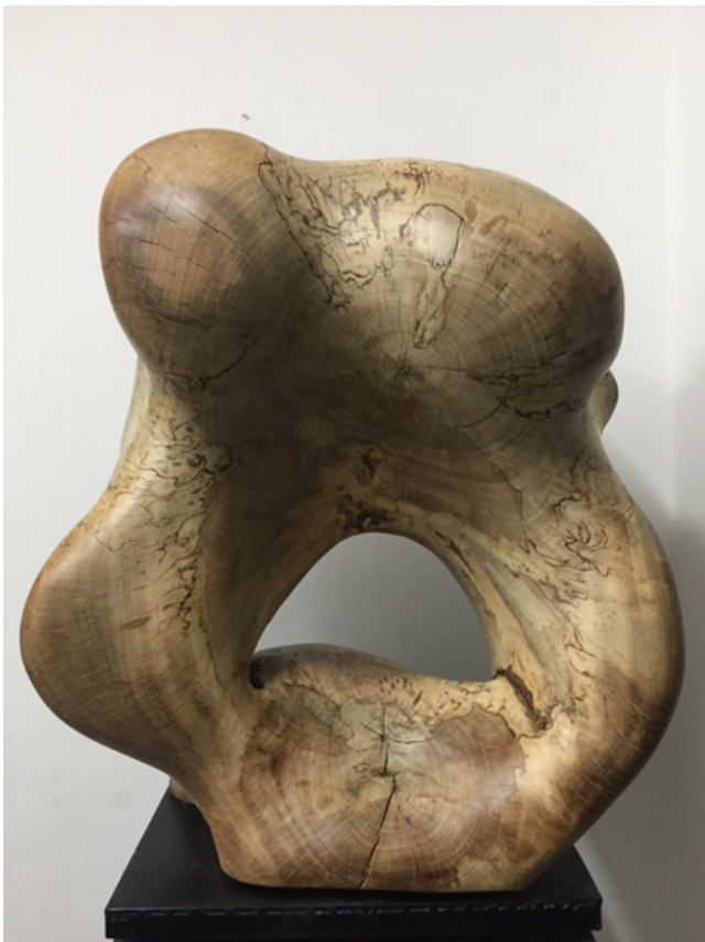
"Abstracto" Madera recuperada tallada 85x50x50 cm 2019