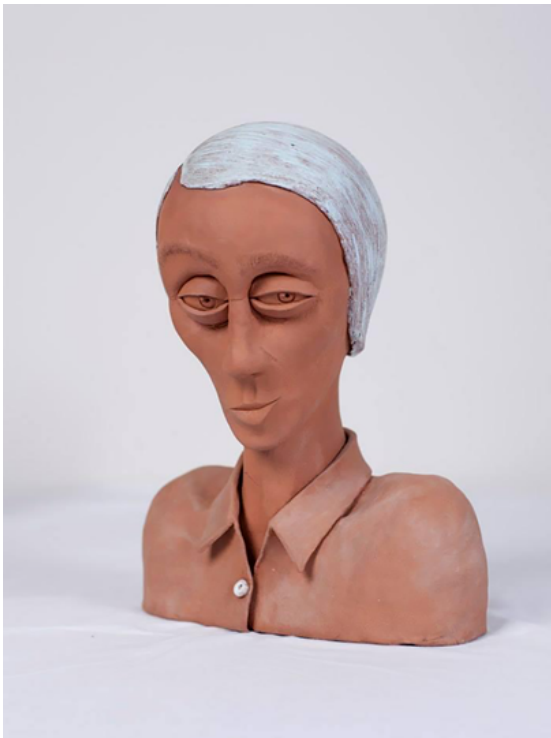
"Untitled" Cerámica gress 40x25x20 cm 2013