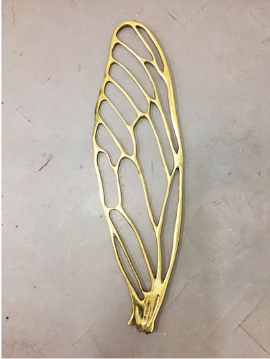
"Cigarra Bronce" Vaciado en bronce 109x35x6 cm 2018