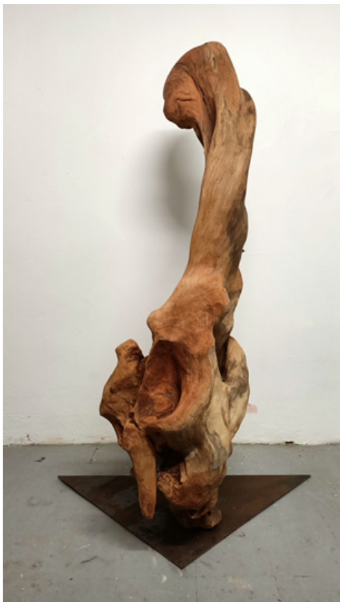
"Fragmento de obra fósil" Escultura de madera recuperada 169x106x56 cm 2021